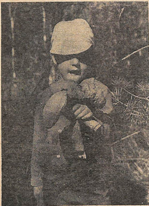
На снимках: внизу слева — высаживаем «десант»; вверху справа — в байдарке плывут наши старшие дети, сменяя друг друга; внизу — вот это находка!